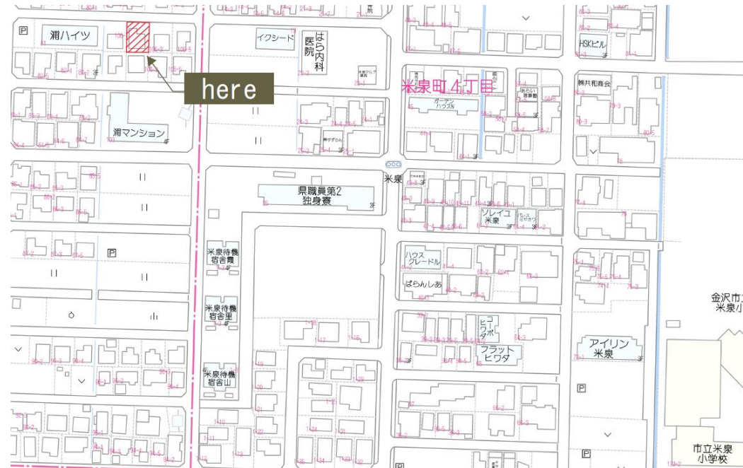
※2枚目に広域地図あります